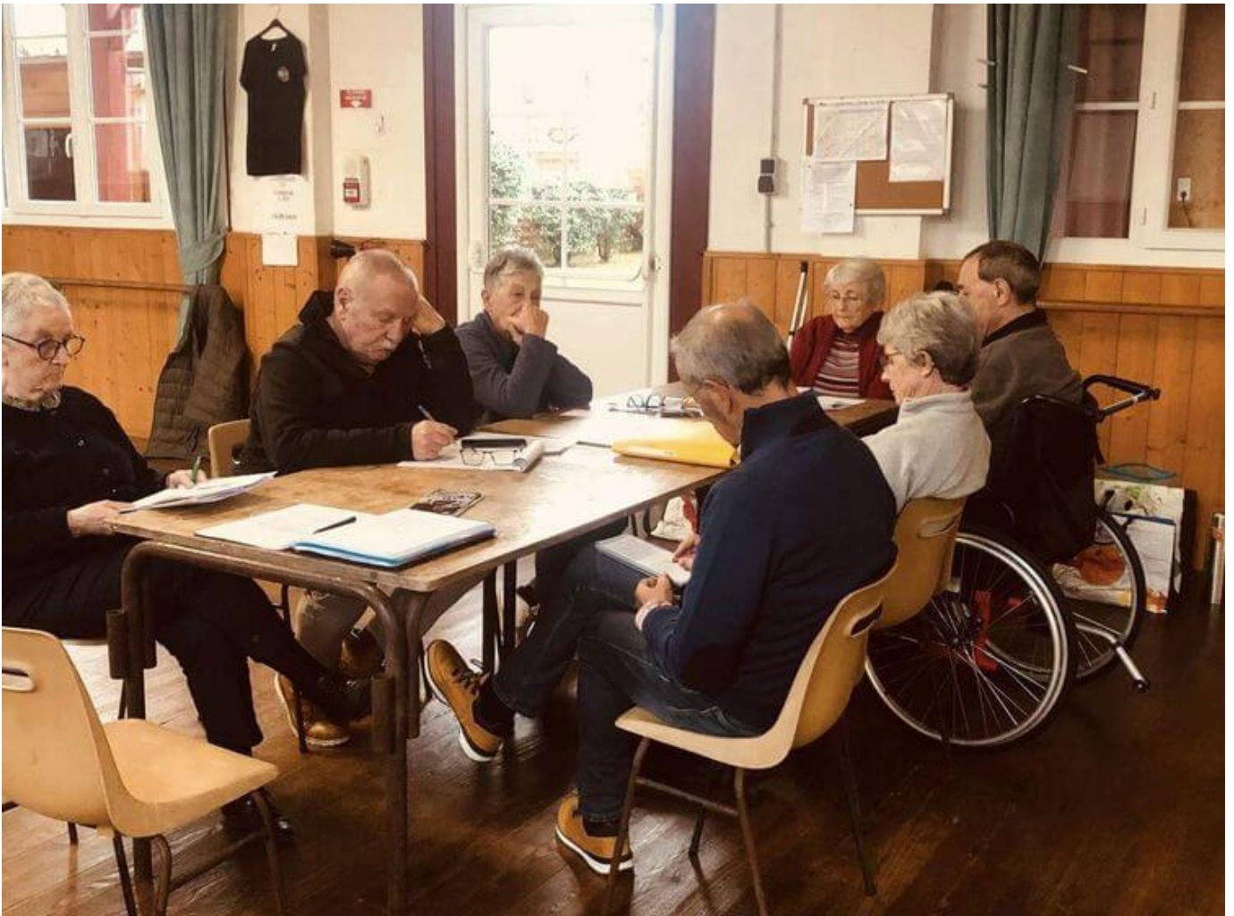
Des seniors partagent un moment dans un espace commun

Mais quel est donc ce concept de « Maisons partagées » ? Ce sont tout simplement des logements pouvant accueillir de 8 à 10 personnes de plus de 65 ans, autonomes ou semi-autonomes. Ces seniors vivront donc sous le même toit, chacun dans son appartement privé, et se retrouveront dans des espaces communs leur permettant d'avoir à nouveau une vie sociale.