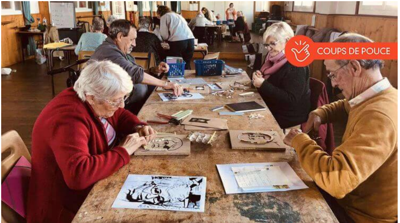
Atelier participatif de l'association Gurekin

Afin de pouvoir transporter les personnes âgées dont s'occupe l'association, un véhicule de 9 places adapté aux personnes à mobilité réduite est nécessaire.